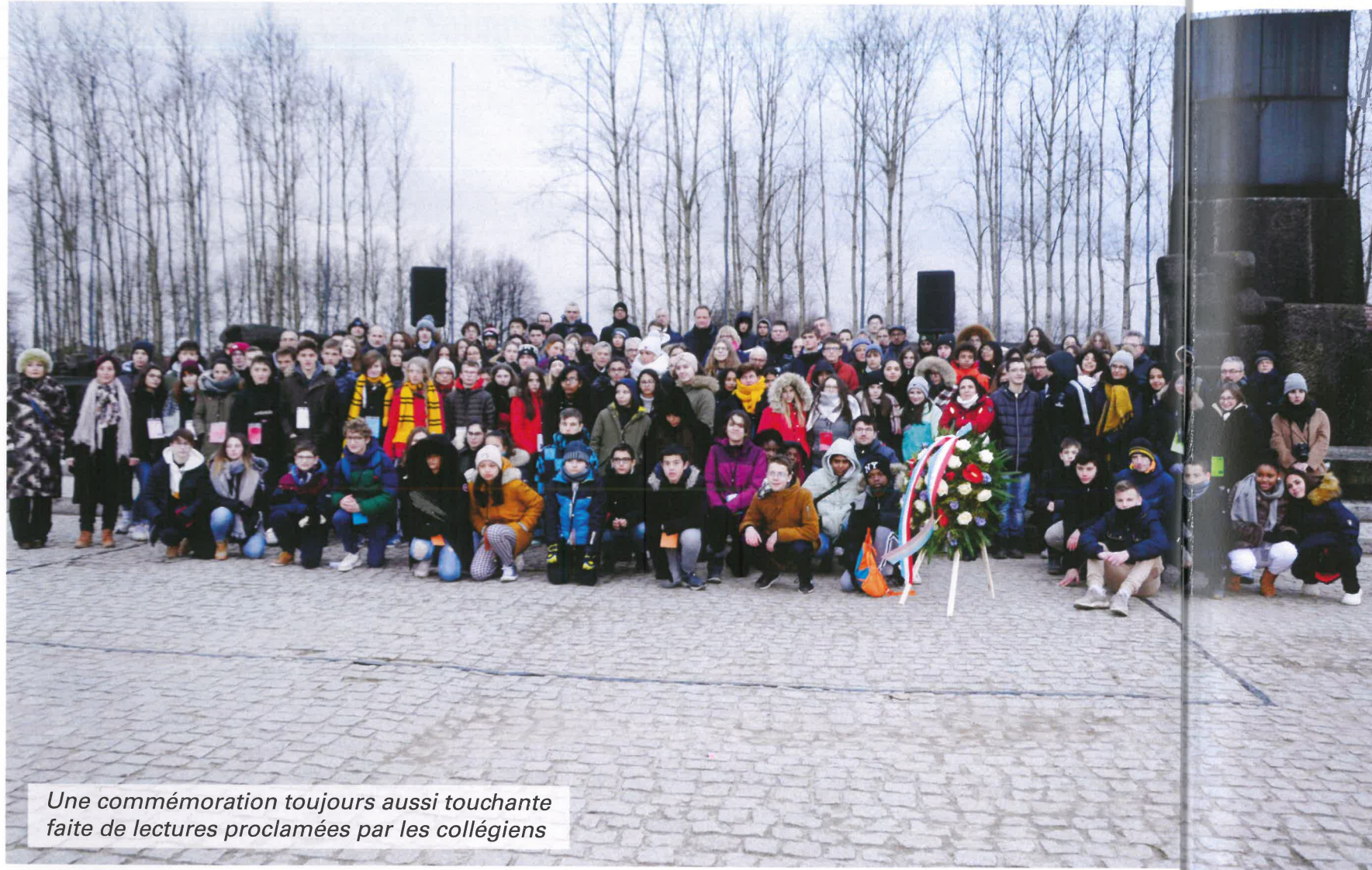
Une commémoration toujours aussi touchante faite de lectures proclamées par les collégiens